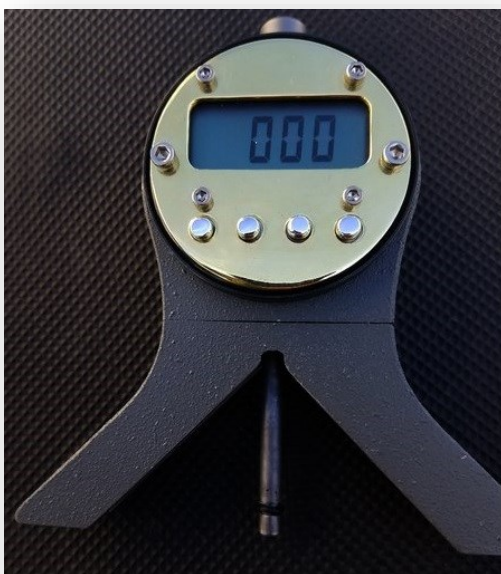
Type 900- digitaal